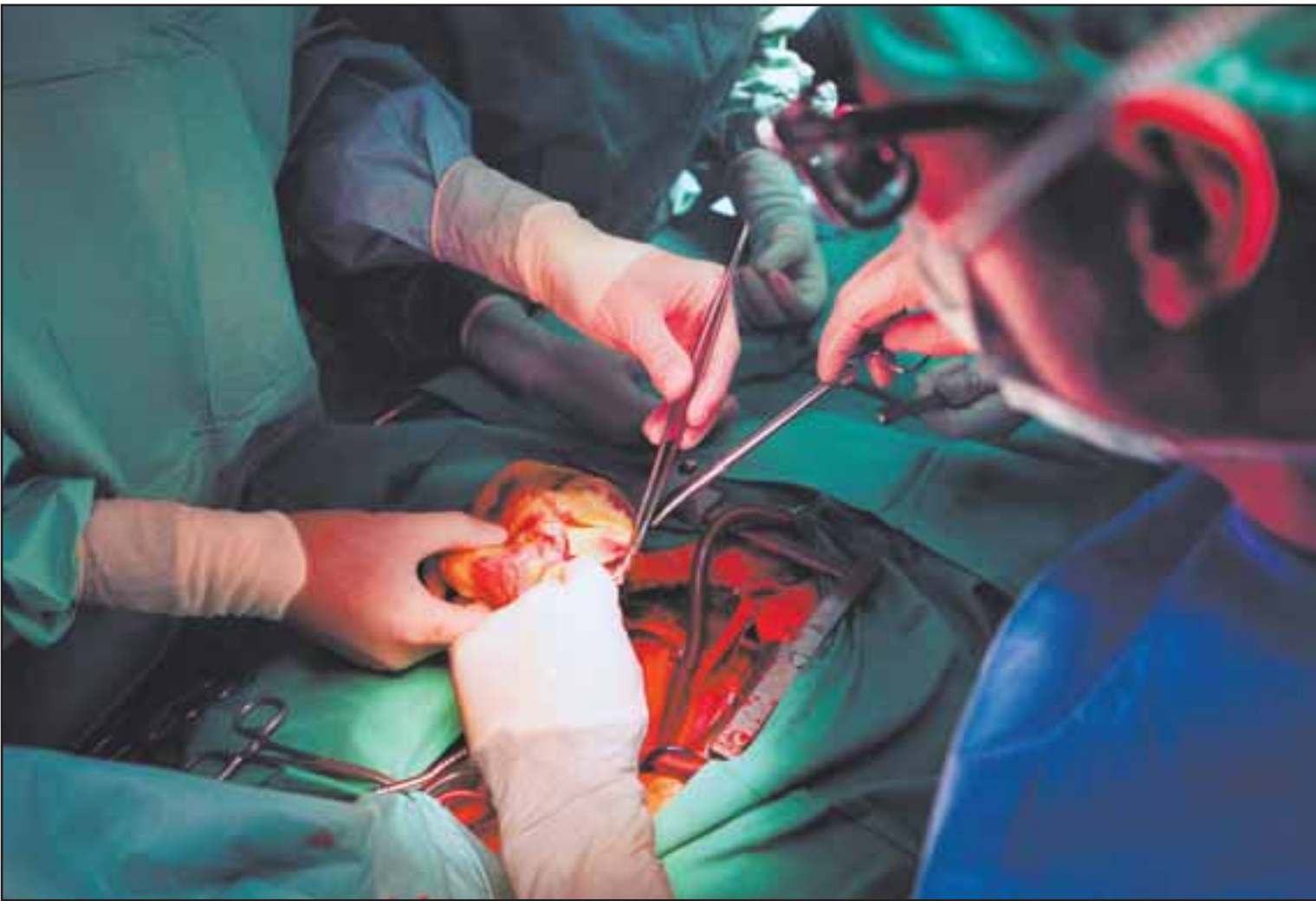
Plus de 700 patients ont reçu un nouveau cœur en Suisse depuis 1986, dont 29 en 2004 alors qu'ils étaient 61 en liste d'attente.

nouvelle vie en 2004. Pour que d'autres aient la même chance, il a créé l'association A Cœur ouvert.